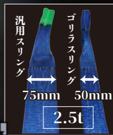
■ゴリラスリング荷重表

このベルトスリング「最強にて」 当社従来品の ベルトスリング(JIS)と 比較し、約1.5倍の 耐荷重へと進化。 ベルト幅・スリング 本体重量はそのまま、 強くなっても 軽く扱いやすい。